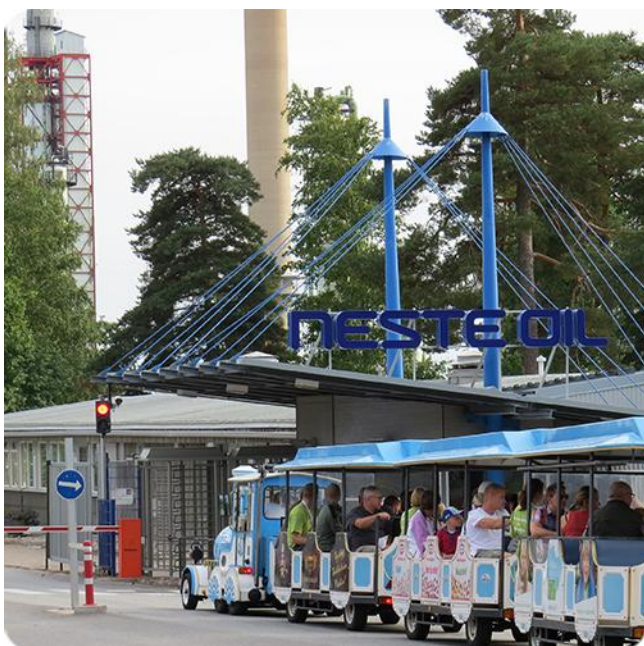
Muumijunan kyytiin oli tungosta vuoden 2013 Naapurikutsuilla.

Ohjelmassa on mm. jalostamon toiminnan esittelyä, kiertoajelu ja alueella, tutustuminen laadunvalvontalaboratorioon, maukasta tarjoilua sekä vauhdikas rallisimulaattori. Mentalisti tulee paikalle hämmentämään mieliämme ja lapsille on luvassa omaa ohjelmaa. Lähetämme tilaisuuteen erillisen kutsun, ja ohjelma tulee löytymään myös Facebook-sivuiltamme www.facebook.com/naantalinjalostamo .